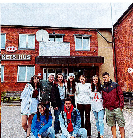
Deltagare i ungdomsutbytet GOBI